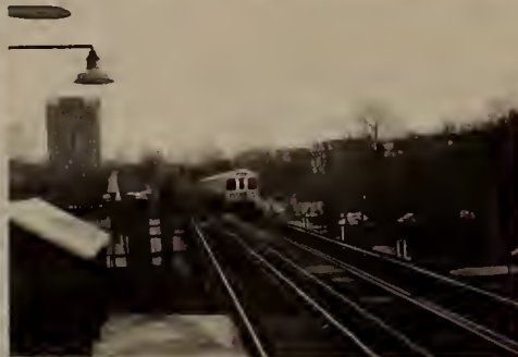
Looking in Town from Egleston Station